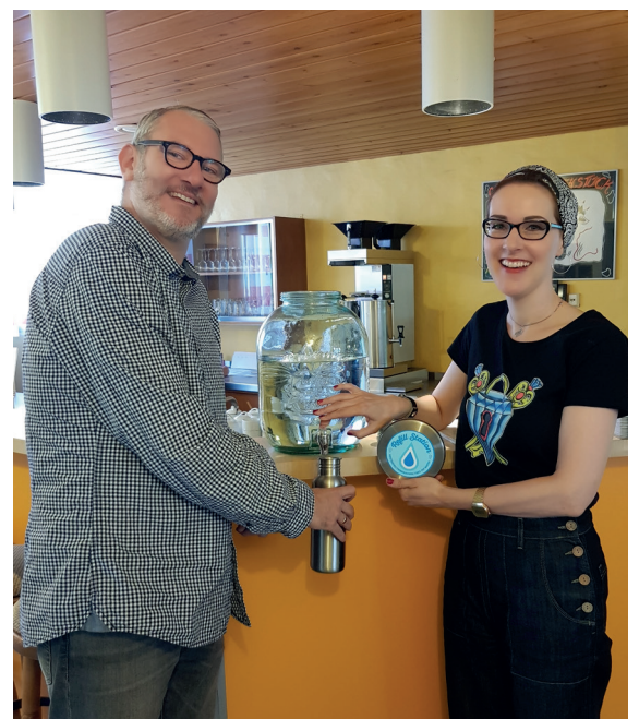
Mögliche Refill-Station: An einer gefüllten Glaskaraffe können Trinkflaschen einfach mit Leitungswasser aufgefüllt werden.

*Eine „Refill-Station“ ist ein Ort, an dem Menschen unkompliziert Leitungswasser trinken und ihre Trinkflasche auffüllen können.