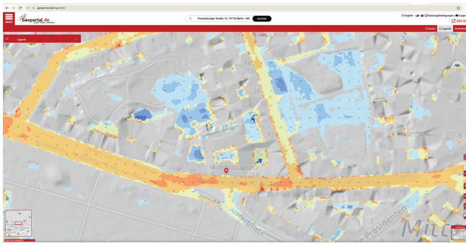
Abbildung: Flussrichtung und -geschwindigkeit im Falle eines Starkregenereignissen am Standort der alten Geschäftsstelle des Paritätischen Gesamtverbandes im Geoportal (Screenshot).